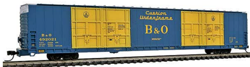
Bluford Shops 86' Auto Parts Boxcar div. Gesellschaften Euro 21,50