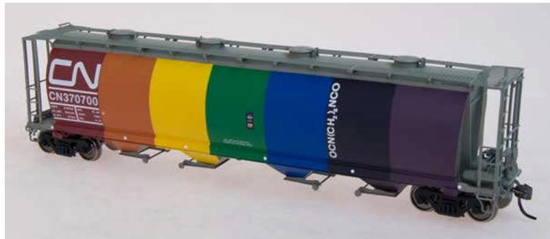
Intermountain cyl. Hopper div. Gesellschaften Euro 18,50

Beachten Sie auch unsere Angebote für Gleise von Peco , Atlas , Gebäude von Walthers und unsere DVDs .