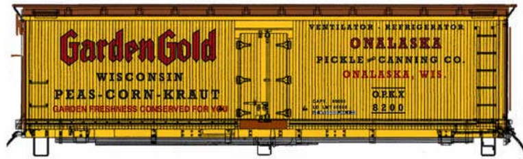
Intermountain Wood Reefer div. Gesellschaften Euro 15,90