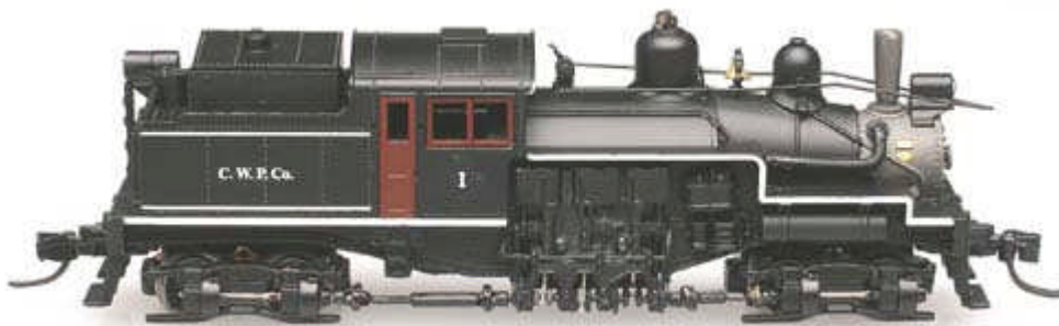
Atlas Two Truck Shay DC Ausführung div. Gesellschaften Euro 152,90