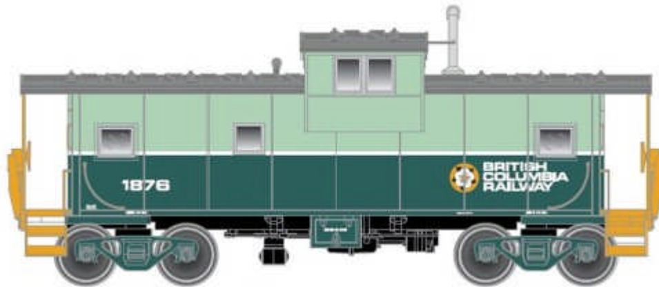
Atlas Extended Vision Caboose div. Gesellschaften Euro 23,90