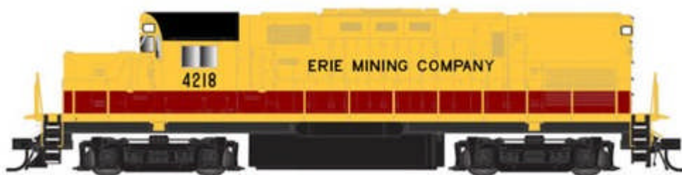
Atlas Alco C-420 DC Ausführung div. Gesellschaften Euro 94,50